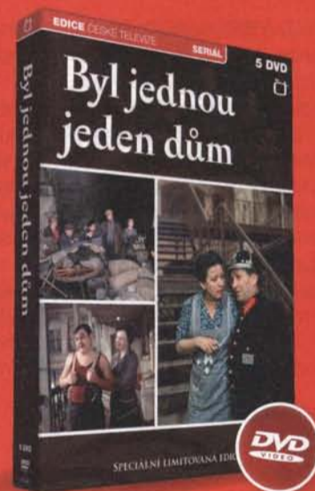
Byl jednou jeden dům Komplet 5 DVD 655,-

Zakoupíte v běžné prodejní síti, na e-shopu ČT www.ceskatelevize.cz/eshop a objednáním na telefonním čísle 387 222 555